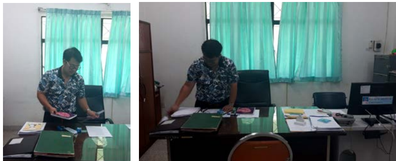
ภาพก่อนจัด 5ส.